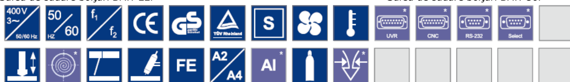
Sursa de sudare bolțuri BMH-30i